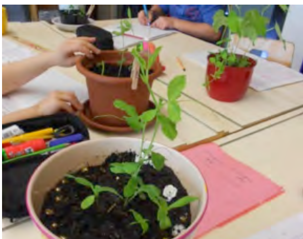
Beobachtung und Dokumentation zum Pflanzenwachstum.

Einblick in konkrete, erprobte Beispiele der SWiSE-Schulen gibt der dritte Band der dreiteiligen SWiSE-Buchreihe, «Naturwissenschaften unterrichten – Praxisbeispiele von SWiSE-Schulen», der im Frühling 2017 erscheinen wird. Andrea Lüscher von der Schule Rottenschwil (AG) beschreibt darin beispielsweise ein Unterrichtskonzept zum Thema «Vorwissen zur Forschungsfrage».